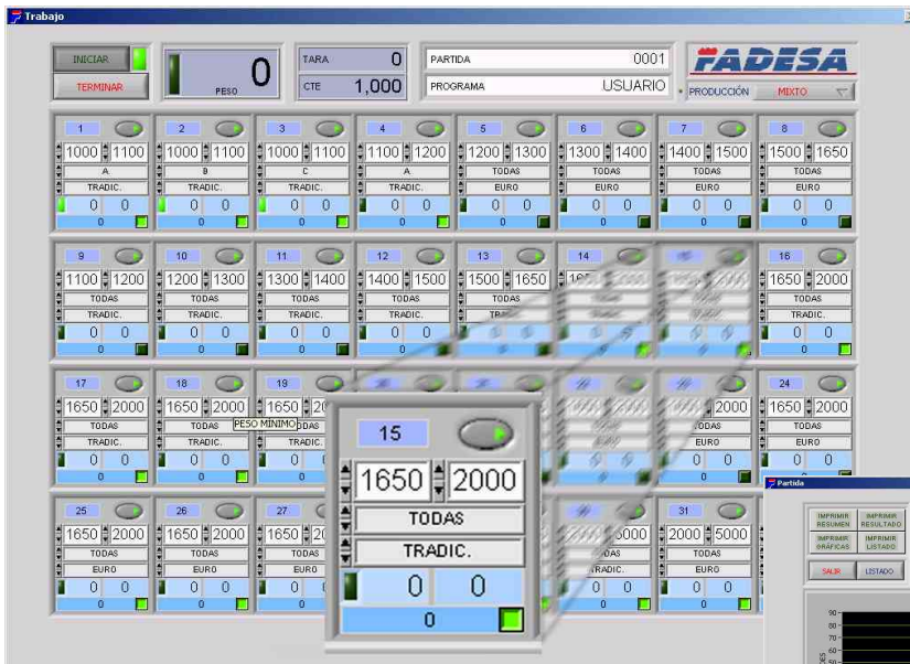
Detalle Pantalla Modo Trabajo

Sistema automático para realizar el clasificado de aves. Aplicación desarrollada e instalada en el sector de mataderos de aves.