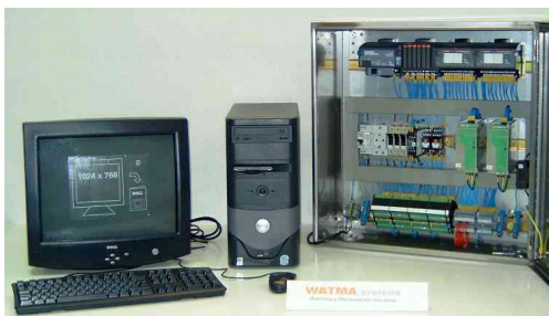
Detalle del Equipo Completo